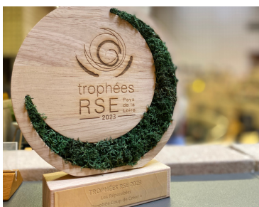
Coup de cœur trophées RSE Pays de La Loire 2023

Les rapports RSE 2021 et 2022 sont consultables sur le site