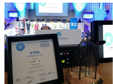
2ème prix catégorie projets excellence artisanale 2021