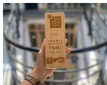
Lauréat Vendée Graine de Boss 2023